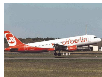
Air Berlin fliegt künftig ab Graz. airberlin

€ Der deutsche Billigflieger „Air Berlin“ übernimmt ab Ende Oktober die Verbindung Graz-Köln. Viermal pro Woche heben die Air-Berlin-Jets in die Rheinmetropole ab. Damit ergeben sich neue Möglichkeiten: So kann man direkt ab Graz durch Umsteigen in Köln nach Hamburg reisen.